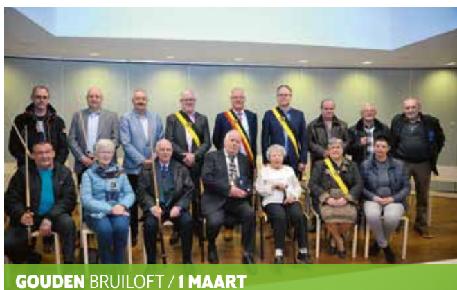
GOUDEN BRUILOFT / 1 MAART