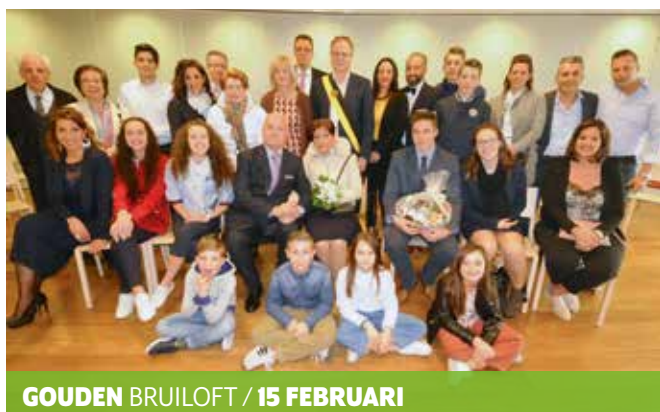
GOUDEN BRUILOFT / 15 FEBRUARI