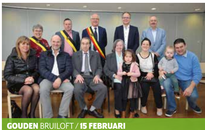
GOUDEN BRUILOFT / 15 FEBRUARI