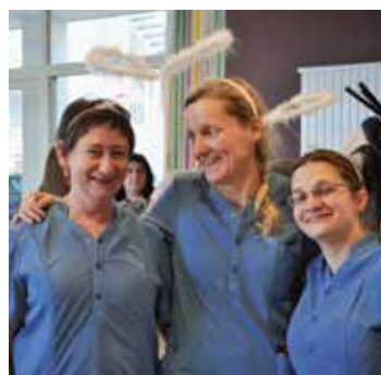
Het animatieteam van de Zilverlinde is helemaal klaar voor het Valentijnsbal.