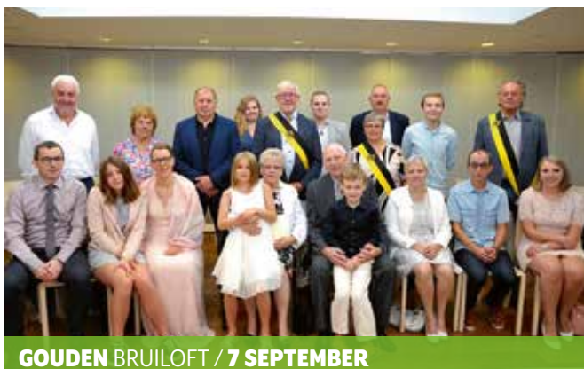
GOUDEN BRUILOFT / 7 SEPTEMBER