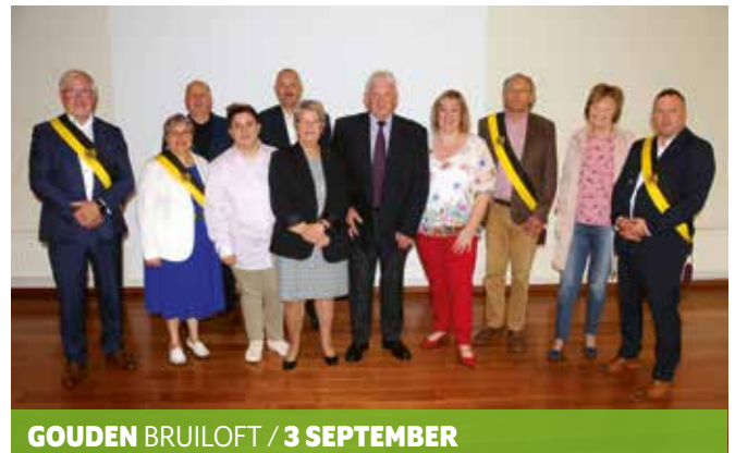
GOUDEN BRUILOFT / 3 SEPTEMBER