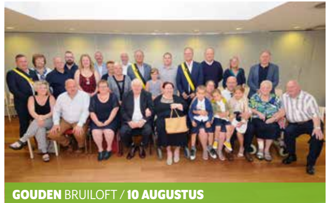
GOUDEN BRUILOFT / 10 AUGUSTUS