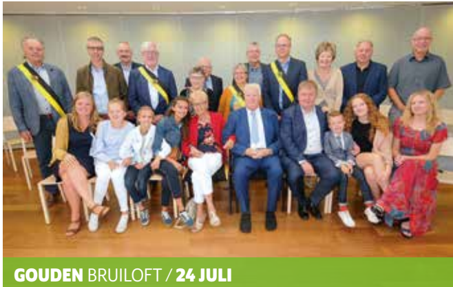
GOUDEN BRUILOFT / 24 JULI