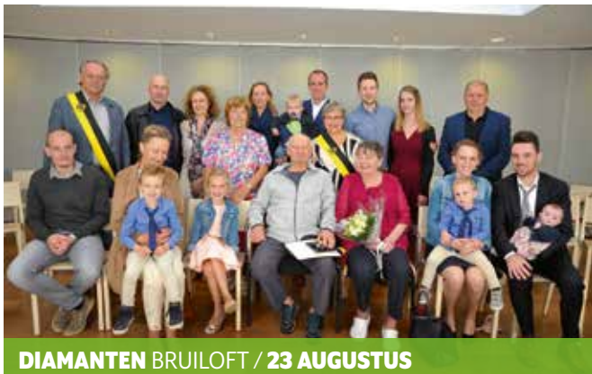
DIAMANTEN BRUILOFT / 23 AUGUSTUS