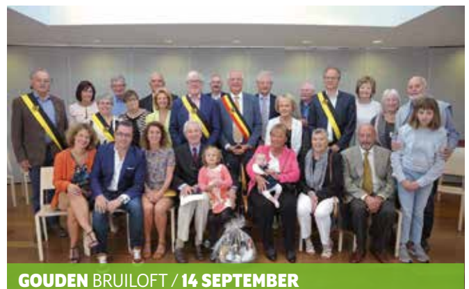
GOUDEN BRUILOFT / 14 SEPTEMBER