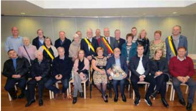
GOUDEN BRUILOFT / 4 NOVEMBER