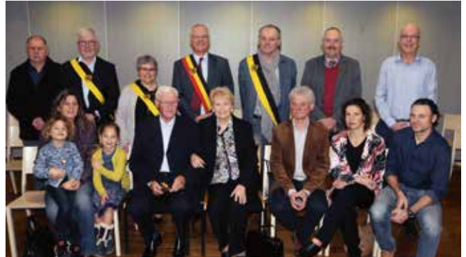
DIAMANTEN BRUILOFT / 23 NOVEMBER