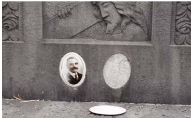
Kleine losse delen worden door gemeente-arbeiders zorgvuldig teruggeplaatst.

Uiteraard blijft de familie eigenaar van alle onderdelen van de graven. Is er iets op het graf van een geliefde verdwenen? Vraag ernaar, misschien ligt het in de opslagruimte te wachten om hersteld en teruggeplaatst te worden.