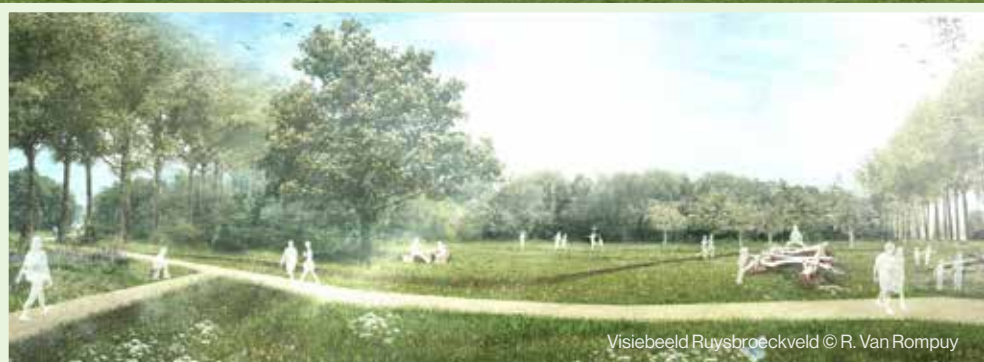
Visiebeeld Ruysbroeckveld