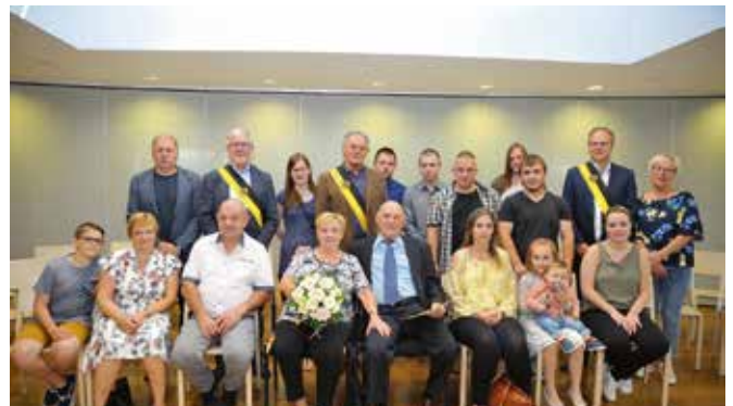
GOUDEN BRUILOFT / 15 JUNI