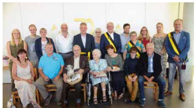
PLATINA BRUILOFT / 19 JUNI