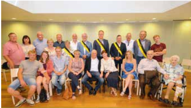
GOUDEN BRUILOFT / 11 MEI