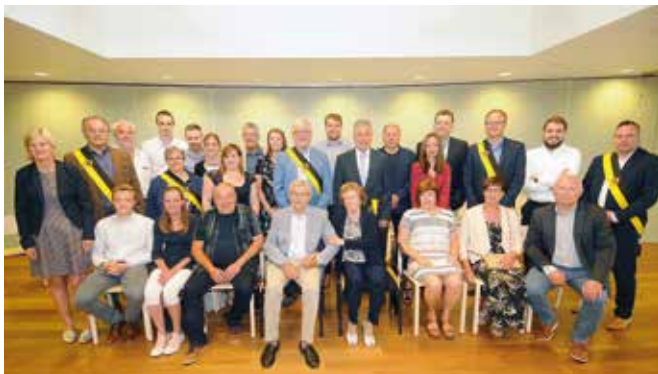
DIAMANTEN BRUILOFT / 7 JUNI