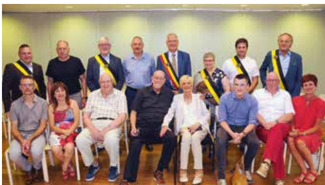
DIAMANTEN BRUILOFT / 16 JUNI