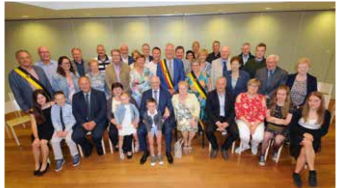
GOUDEN BRUILOFT / 1 JUNI