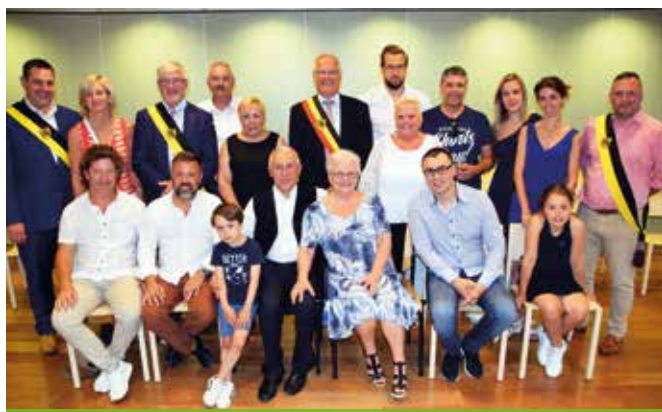
GOUDEN BRUILOFT / 28 JUNI