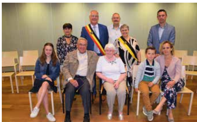
GOUDEN BRUILOFT / 4 JUNI