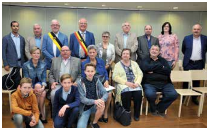
GOUDEN BRUILOFT / 24 MEI