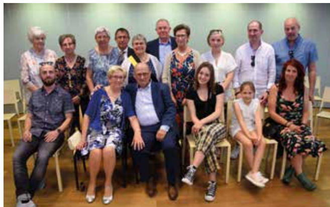
GOUDEN BRUILOFT / 31 MEI