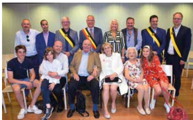
GOUDEN BRUILOFT / 21 JUNI