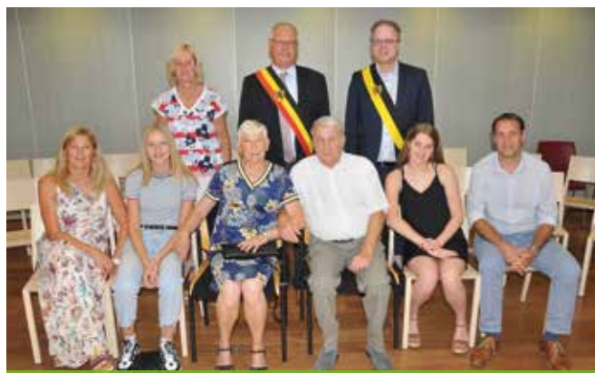
GOUDEN BRUILOFT / 28 JUNI