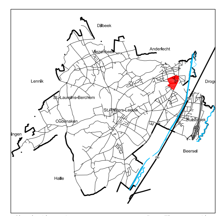
Situering binnen de gemeente.