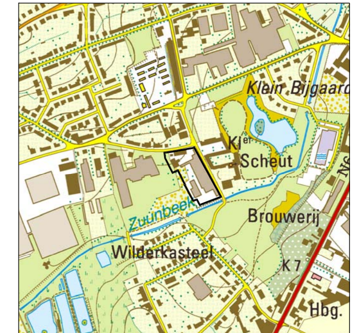
Uitbreuk Topografische kaart - 1/10.000