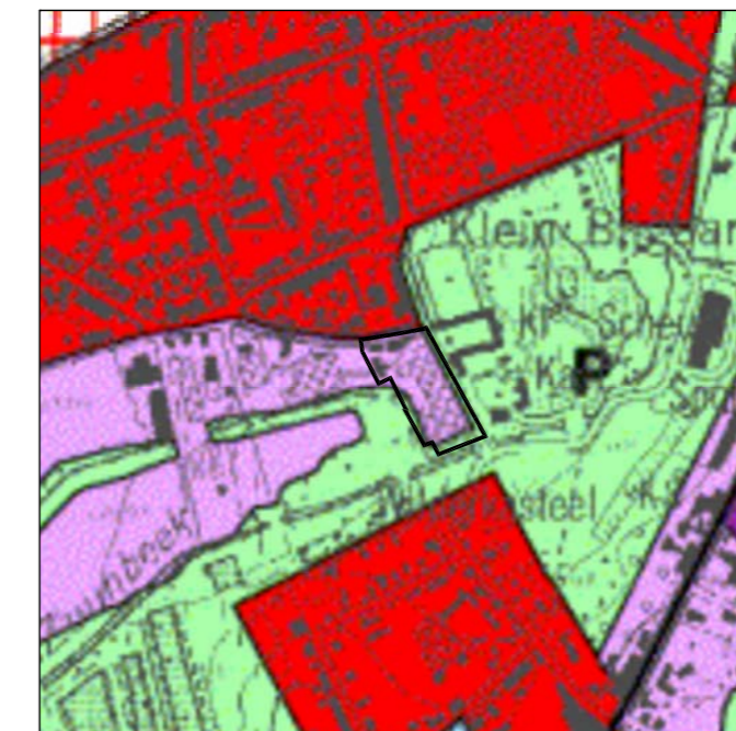
Uitbreuk gewestplan - 1/10.000