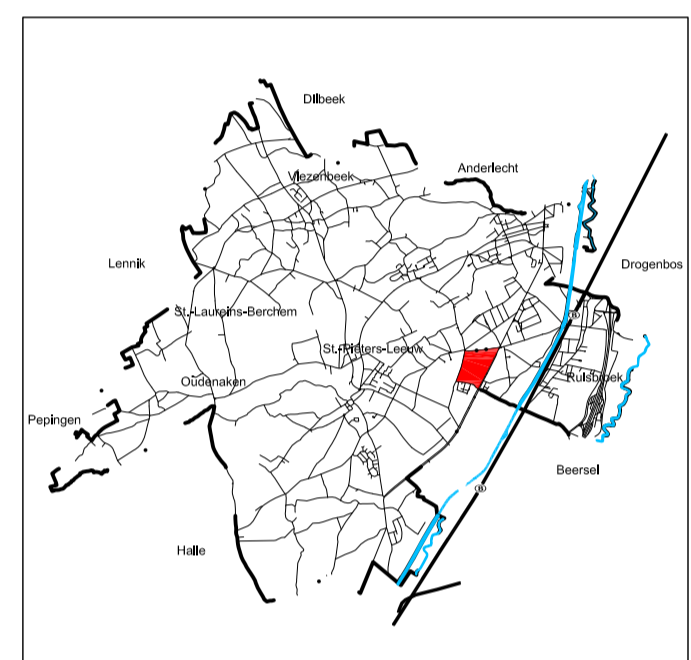
Situering binnen de gemeente - 1:20.000

Verkavelingen binnen het plangebied dienen opgegeven te worden